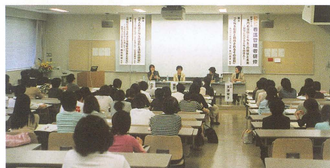
看護管理者研修・専門看護師シンポジウムから

「看護電話相談」事業を実施します。相談窓口は「親子関係・育児不安相談」「子どもをなくした家族等の心理相談」「高齢者ケア・介護についての相談」の3つです。各相談は17年3月までは月1回実施されます。この看護電話相談事業については、県保健福祉センター、市町村等の担当者の方々からも事業実施のご理解をいただくことができ、実施の運びとなりました。看護大学としても、微力ではありま