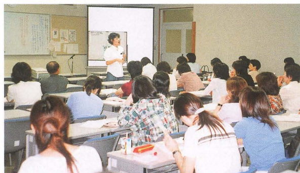
思春期の感染症予防講座から

すが、県民や看護・介護等関係者の方々の相談に応じ、お役にたたせていただきたいと思います。