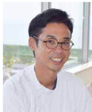
病棟のラウンジにて

今後の夢は、看護外来の開設と共に研究の成果も活かして吸入指導のシステム化を実現したいと考えています。また、実習指導者の任も頂き、後輩たちに自分が経験した最期の時まで人を支えることのできる看護の豊かさを伝えていきたいと願っています。