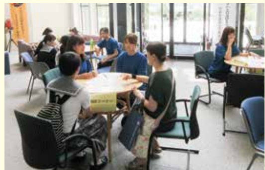
学生達が相談コーナーで高校生へ経験を活かしたアドバイス、自信に満ちた表情…