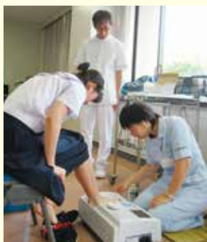
学生は骨密度測定はお手の物、サークル活動で培った成果