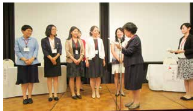
招聘教員への感謝状贈呈