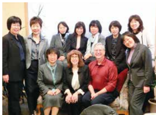
講師と参加者ら(Family Care of Kentにて)