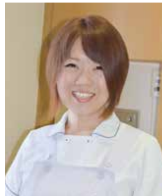
勤務する病棟の病室にて

これからの夢は、チームの中で1人でも多く「おいしい」と言って頂けるような看護実践を重ねたいこと、院内に同じような志をもつ仲間を増やしていきたいこと、日々、誠実に「口から食べたい」と願う患者さんたちの力になりたいと考えています。いつも、自分の家族だったらという学生時代の恩師の言葉を胸に…。